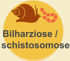
Bilharziose / schistosomose

Bactérie qui se transmet par les urines des rongeurs (rats, ragondins...) qui contaminent les sols et les eaux. L'homme s'infecte par le contact des muqueuses ou d'une plaie cutanée avec de l'eau douce (rivière, lac) ou de la boue contaminées. La maladie donne de la fièvre, et des atteintes du foie et des reins.